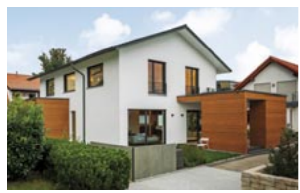
Mit dem zur Gartenseite ausgerichtete Panorama-Cube, einer großzügig überdachten Terrasse, zieht das Musterhaus schon von weitem die Blicke auf sich (auf beiden Fotos jeweils rechts zu sehen).