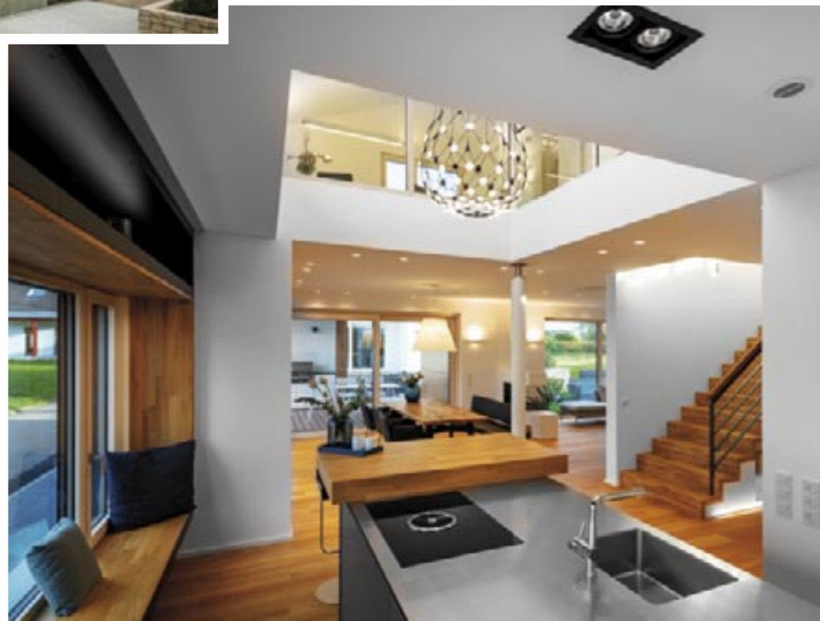
Das Zentrum des Hauses – Küche und Essplatz – markiert der Luft-raum. Der Wohnbereich rechts dahinter dient eher dem Rückzug.