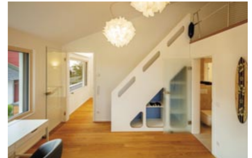
Das ohnehin schon großzügig dimensionierte Obergeschoss erhält mit der Empore noch eine Art Versteck.