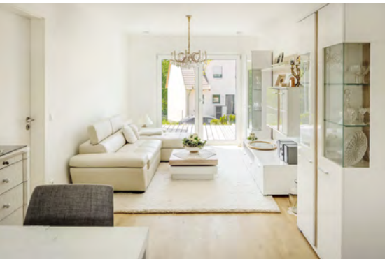
Die Einliegerwohnung im Erdgeschoss ist voll ausgestattet. Hier wird die Mutter der Bauherrin wohnen.

K eine Kompromisse in puncto Licht, Wärme und Sonne – das war die zentrale Maßgabe bei der Entwicklung dieses Holzhauses mit viel Platz und Wohnqualität. Mit der zweifarbigem Fassade, den großen Fenstern, dem Erker und der teilweise überdachten Terrasse bietet das Haus eine spannende Architektur. Der hohe Drempel erlaubt, dass man fast überall im Dachgeschoss stehen kann. Offen, aber gut gegliedert ist der Wohnbereich des Erdgeschosses – von der Küche über den großflächig verglasten