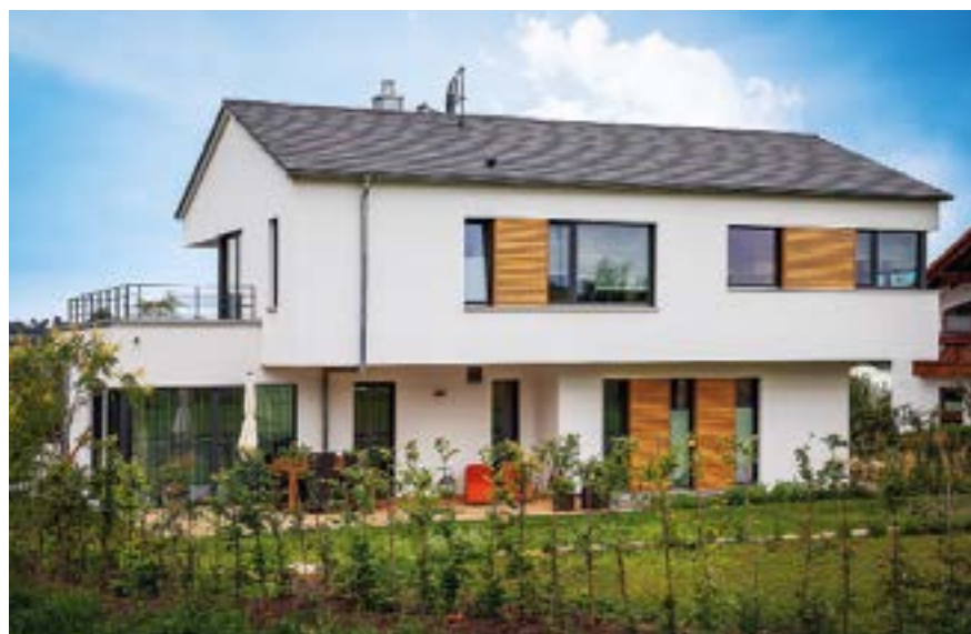
Bauherrenwünsche: eine Terrasse für jede Tageszeit, draußen leben und verschiedene Ausblicke genießen!

Der Fertighausbauer Bittermann & Weiss kam ins Spiel, da Bauweise und -ausführung genau seinen Ansprüchen entsprachen: Ein perfekt aus geprüften Materialien ganz ohne PE-Folie, Hartschaum und Spanplatte errichtetes Holzhaus mit viel Platz, das nicht