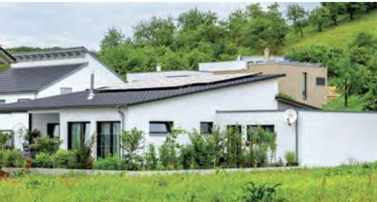
Die gemütliche Terrasse erhält durch das überstehende Dach Schutz vor Wind und Regen.