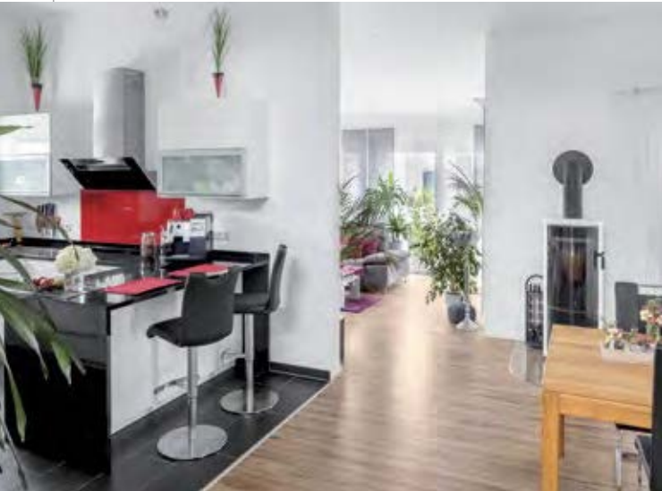
Trotz der Größe von Wohn-, Essbereich und Küche sind die Wege im Erdgeschoss kurz.