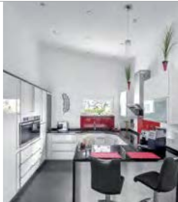
Praktisch für schnelle Mahlzeiten ist die kleine Esstheke in der Küche.