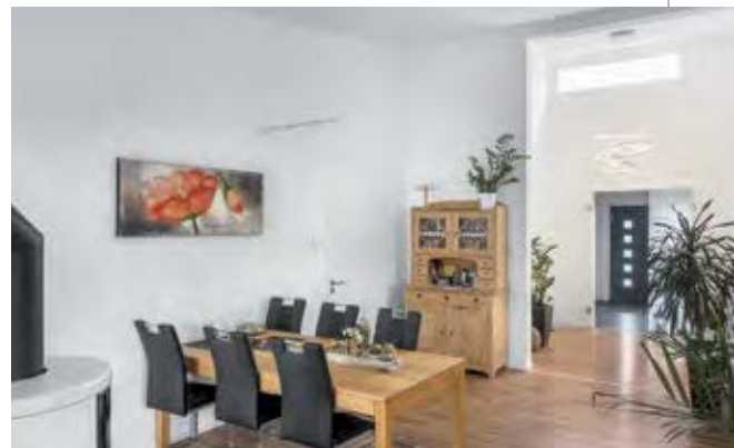
Die geräumige Diele mit reichlich Platz für Schuhschrank und Garderobe erschließt den Wohn- und Essbereich.