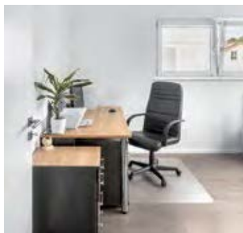
Ein zusätzlicher Raum kann als Arbeits- oder Gästezimmer genutzt werden.