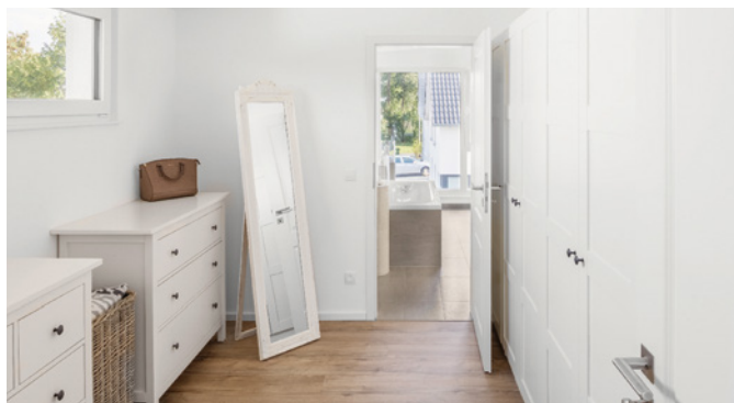
Die Ankleide ist als Verbindungsraum zwischen Elternschlafzimmer und Bad genau richtig angeordnet.

einem Gesamtmaß von 440 mm inklusive vollflächiger Dachverschalung von 16 mm DWD-Platten und einer 240 mm starken Steinwolle-Dämmung bringt nicht nur allerbeste Wärmedämmwerte, sondern schützt die Wohnräume an heißen Sommertagen auch vor unangenehmer Hitze. Dazu bringt dieses Dach deutlich besseren Schallschutz und ist wind- und witterungsbeständig. So bekommt der Rohbau eine schützende diffusionsoffene Hülle aus einem Guss, die ihren