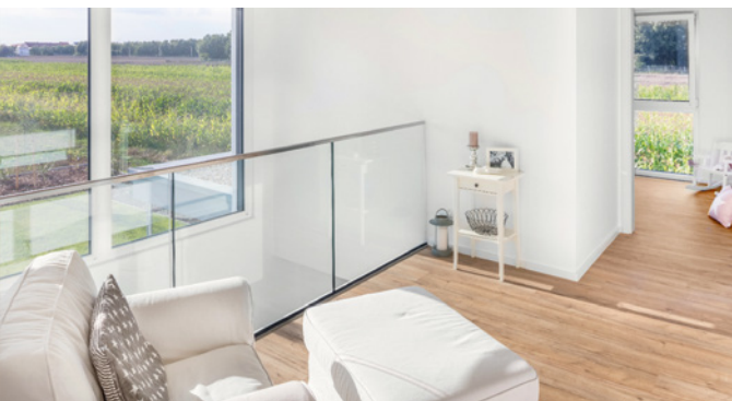
Cleverer Gestaltungsstrick: Dank transparentem Geländer fällt noch mehr Tageslicht auf die Galerie.