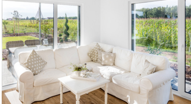
Viele bodentiefe Fenster und Terrassentüren stellen im Erdgeschoss die Verbindung ins Grüne, zum Garten, her.