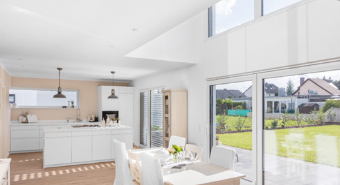
Über dem Essplatz öffnet sich der Wohnbereich bis unter das Dach und generiert so eine Wirkung von Weite.